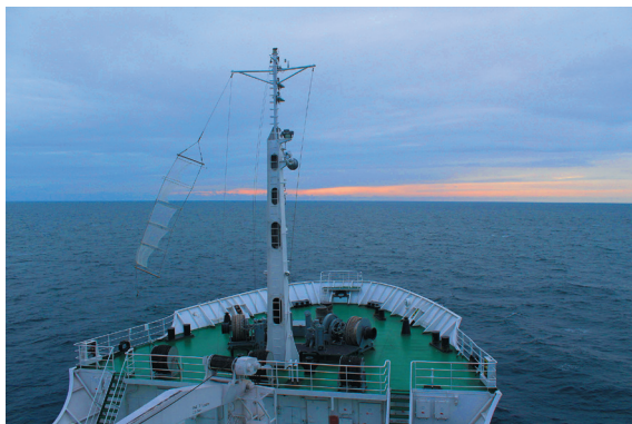
Рис. 1. Нейлоновые сети для сбора аэрозолей на баке НИС «Академик Мстислав Келдыш». 2015 г.

минералогический анализ. Одновременно с этим используются счетчики частиц разных систем, привлекаются спутниковые данные о запыленности атмосферы.