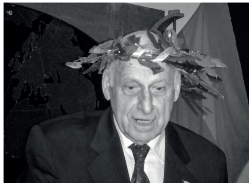
Рис. 8. Лавровый венок от сотрудников Лаборатории физико–геологических исследований после получения премии «Триумф–наука», 2008 г.

За свою долгую жизнь А.П. Лисицын был награжден множеством орденов и медалей – как военных, так и гражданских. Он был лауреатом двух Государственных премий СССР (в авторском коллективе): за создание «Атласа Антарктиды» в двух томах в 1971 г. и за монографию «Тихий океан» в 10 томах в 1977 г. В 2008 г. бизнес–сообщество выбрало А.П. Лисицына лауреатом премии «Триумф–Наука» (рис. 8).