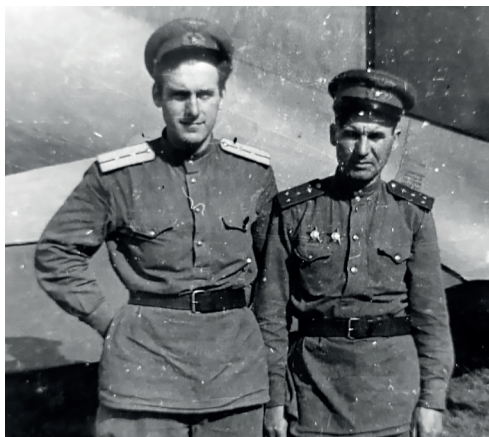
Рис. 2. Штурман Авиации дальнего действия А.П. Лисицын с бортмехаником, 1944 г.

С 1948 г. началась «морская» карьера А.П. Лисицына. Еще студентом он поступил лаборантом в недавно созданный (1946 г.) Институт