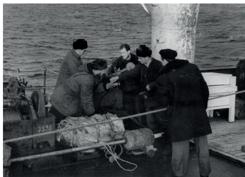
Рис. 3. Работа геологического отряда с грунтовой трубкой в рейсе дизель-электрохода «Обь», 1956 г.