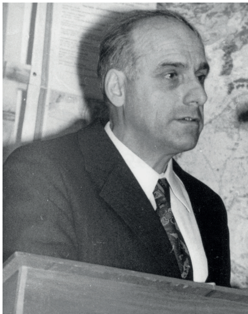
Рис. 6. Школа по морской геологии, Геленджик, 1974 г.

области геологии морей и океанов, которые привели к открытиям исключительной важности (тектоника литосферных плит, поступление эндогенного вещества на дно океана и формирование современных сульфидных месторождений и др.), запаздыванием публикаций об этих открытиях, необходимостью оперативного обсуждения новых представлений в морской геологии. В разные годы в работе Школы активно участвовали ведущие ученые–геологи нашей страны – академики АН СССР А.Л. Яншин, В.Е. Хаин, А.С. Монин, Д.М. Пущаровский, Е.Е. Милановский, А.Н. Дмитриевский; члены–корреспонденты АН СССР П.Л. Безруков, Л.П. Зоненшайн, Н.А. Богданов, Ю.Г. Леонов и другие. Число иностранных участников менялось: с докладами выступали иностранные ученые – К.О. Эмери (K.O. Emery), С. Хонжо (S. Honjo), Э. Бонатти (E. Bonatti), П. Вассман (P. Wassmann), В. Иттекот (V. Ittekkot), Ж. Мартин (J. Martin), Х. Аоки (H. Aoki), Й. Тиде (J. Thiede), Х. Кассенс (H. Kассens).