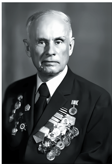
Рис. 2. Член-корреспондент АН СССР В.В. Тихомиров (1915–1994).

Работа в Комиссии привлекла в круг историков науки многих геологов страны, что усилило это направление. В.В. Тихомиров вывел его на новый уровень.