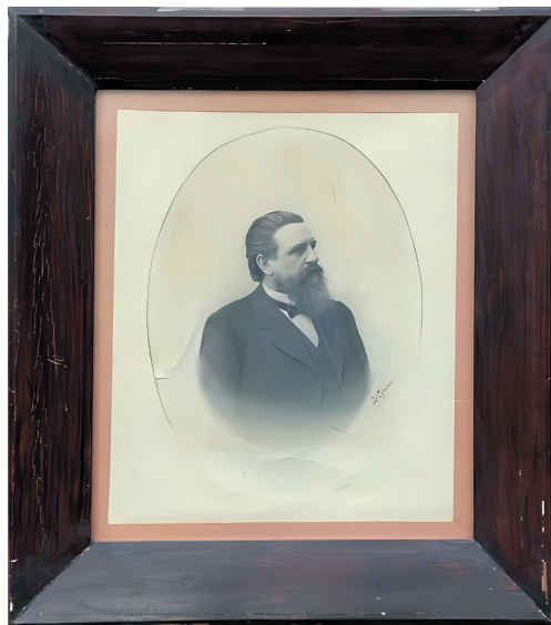
Рис. 4. Иван Васильевич Мушкетов (1850–1902).

После его кончины в Отдел истории геологии были переданы два портрета из московской квартиры В.А. Обручева, которые всегда висели на стене его кабинета.