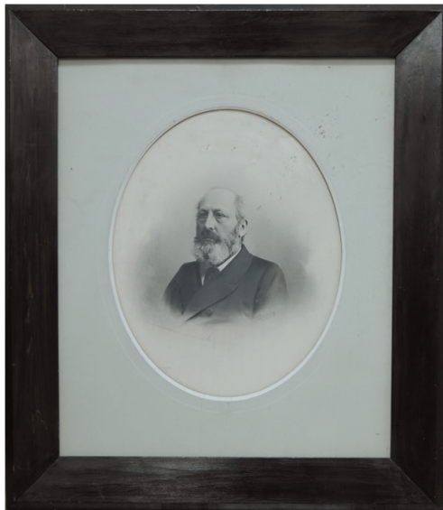
Рис. 5. Эдуард Зюсс [Suess, Eduard] (1831–1914)

Имена В.А. Обручева и Э. Зюсса связаны навсегда благодаря совместной работе.