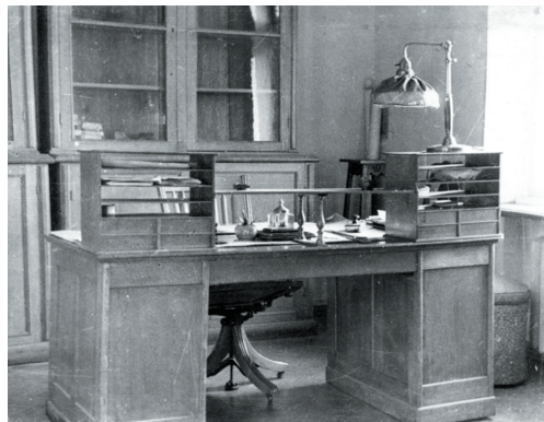
Рис. 3. Кабинет В.А. Обручева в ГИН АН СССР.

До последних дней жизни В.А. Обручева в Институте сохранялся его кабинет, интерьер которого не менялся ни в Ленинграде, ни в Москве.