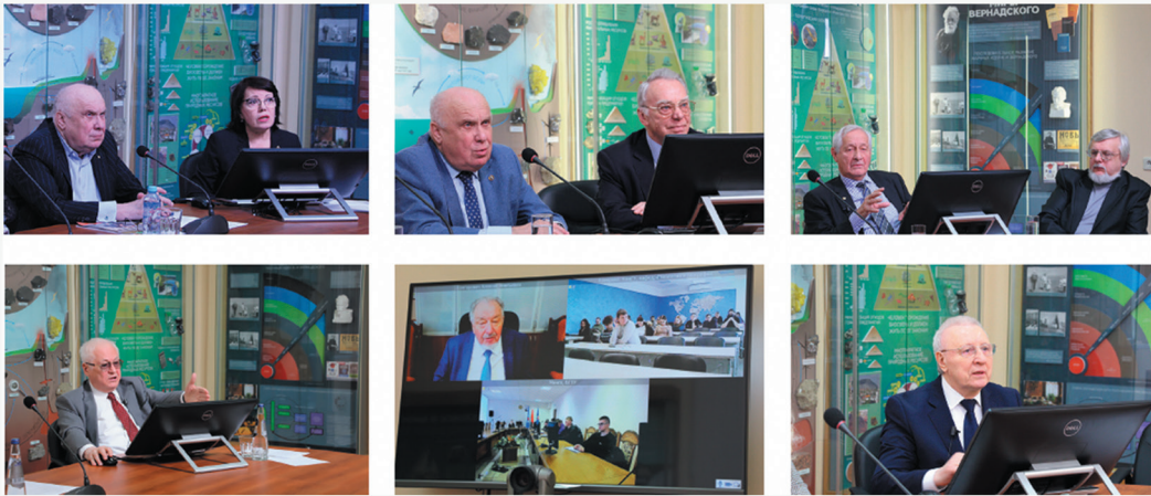
Рис. 4. Телемосты с участием ведущих ученых

Создавая коммуникационную среду, объединяющую все социальные группы детей и молодежи, используя современные интерактивные приемы, музейные средства, привлекая к работе высокопрофессиональную армию педагогов, музей формирует профильное инновационное мышление в современной экономической формации. Учитывая современный быстрый темп технологического развития и соответствующего усиления давления цивилизации на среду обитания, на всех уровнях подготовки молодого поколения упор делается на фундаментальные базовые аспекты, в том числе – экологические.