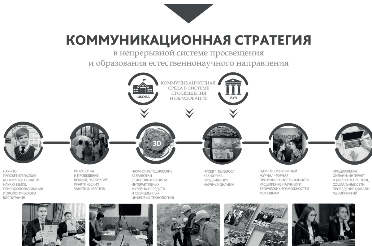
Рис. 3. Коммуникационная стратегия в непрерывной системе просвещения и образования по естественно-научному направлению

естественно-научного направления (рис. 3, Малышев и др., 2018). Совершенствуются приемы, создаются и внедряются новые высокотехнологичные авторские интерактивные программы.