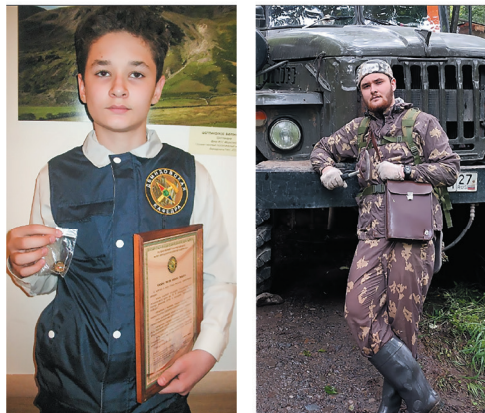
Рис. 6. От Клуба юных геологов до студенческой практики