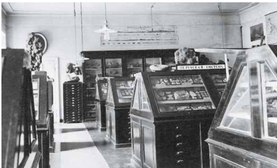
Рис. 7. Геологический кабинет Императорского Московского университета. Фото 1911 г.