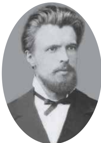
Рис. 3. А.П. Павлов. 1881 г.