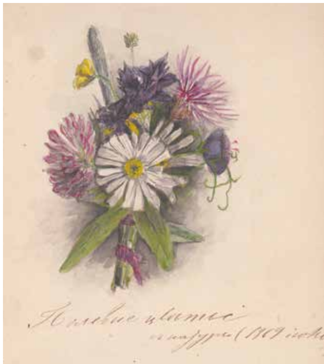
Рис. 11. Рисунок А.П. Павлова из альбома. 1869 г.