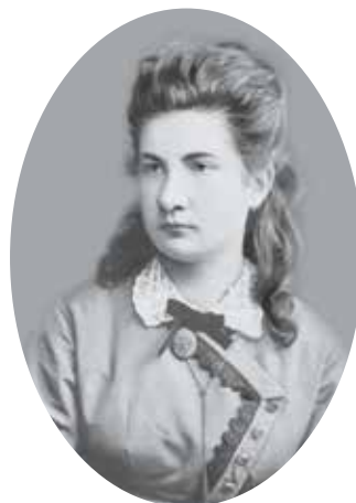
Рис. 4. М.В. Иллич-Шишацкая. 1874 г.