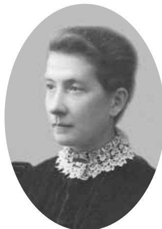
Рис. 6. М.В. Павлова. Фото 1890-х гг.