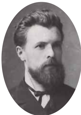
Рис. 5. А.П. Павлов. Фото 1885 г.