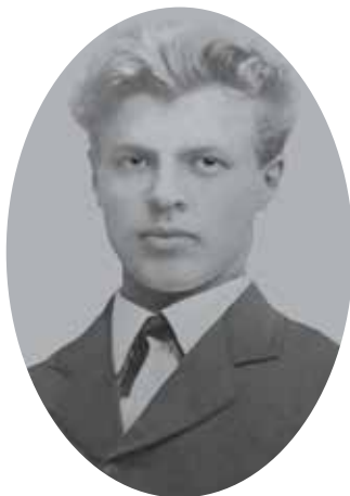
Рис. 1. А.П. Павлов. 1870-е гг.