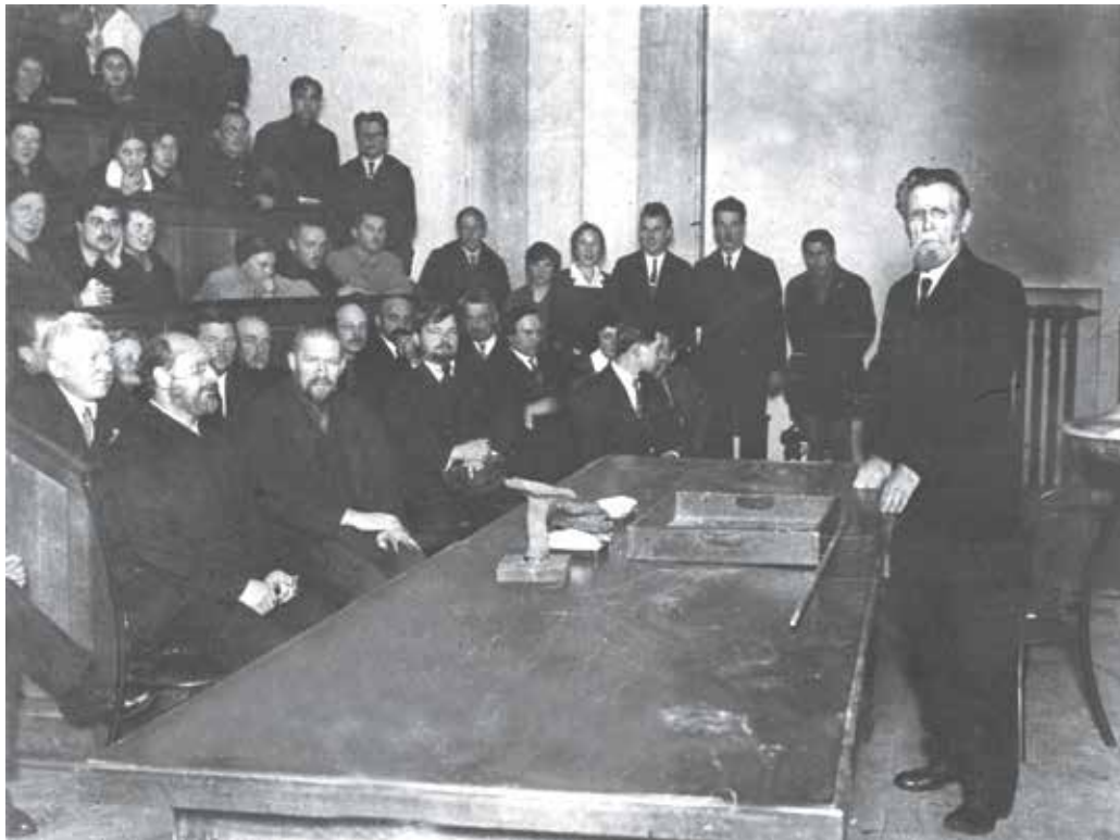
Рис. 9. Последняя лекция А.П. Павлова в лекционной аудитории НИИ геологии при I МГУ, 1928.

крупный и прекрасный человек» (Мазарович, Добров, Меннер, 1940, с. 40). На сохранившейся фотографии видно, как много народа пришло на последнюю лекцию А.П. Павлова (рис. 9).