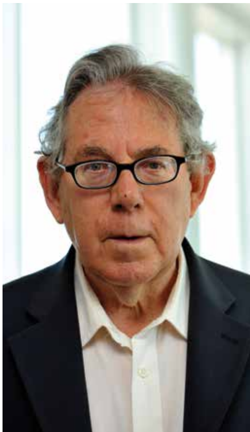
Рис. 2 Пауль Йозеф Крутцен.

процессов на поверхности Земли, причём он выполнен во времена, когда объём доступных данных был гораздо меньшим, чем сейчас. Во введении к французскому изданию этой книги, вышедшему в 1928 г., Вернадский отмечал: "Стараясь твёрдо держаться эмпирических основ, не прибегая к гипотезам, мне приходилось довольствоваться скудным числом точных наблюдений и данных строго поставленных экспериментов. Крайне необходимо, чтобы как можно быстрее были собраны большие объёмы количественно подтверждённых фактов. Пройдёт немного времени и более глубокое понимание биосферы в жизненных явлениях станет очевидным". Жизнь подтвердила его слова.